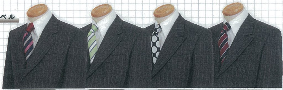
No01 ノッチ No02 セミノッチ No03 ピーク No04 セミピーク