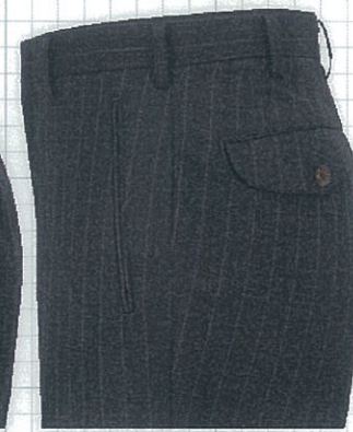
No.08 両玉タテ OP