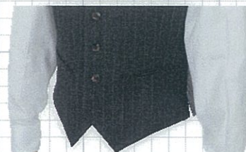
No.02 両玉 OP