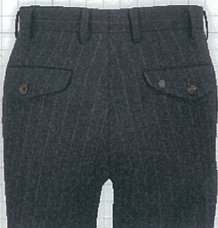
No.03 両ポケット雨フタ付き