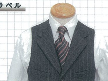
No.01 ノッチ OP