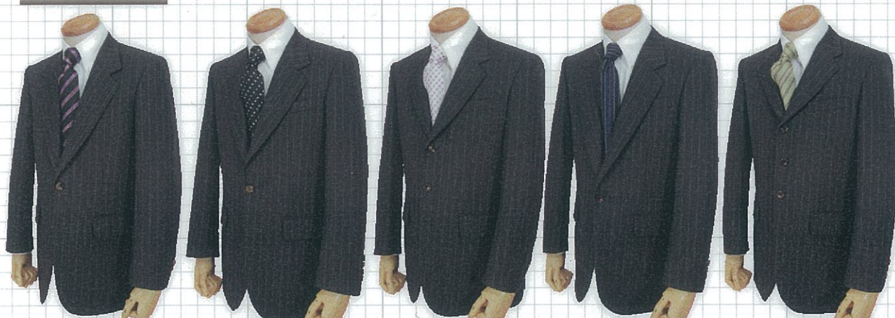
S 2 釦 1 掛け S3 釦 中 段 返 り 中 1 掛 け S3 釦 2 掛 け S1 釦 S4 釦 3 掛 け