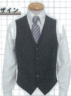
No.411 S 5釦5掛け