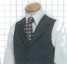
OP No.04 両ポケットハコ