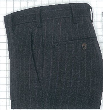
No.01 ナナメ 標準