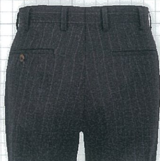
No.01 左ポケットのみ釦止め 標準