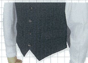
No.03 両玉フラップ OP