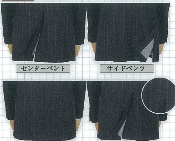
センターベント サイドベント