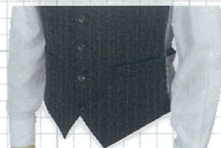
No.01 ハコ 標準