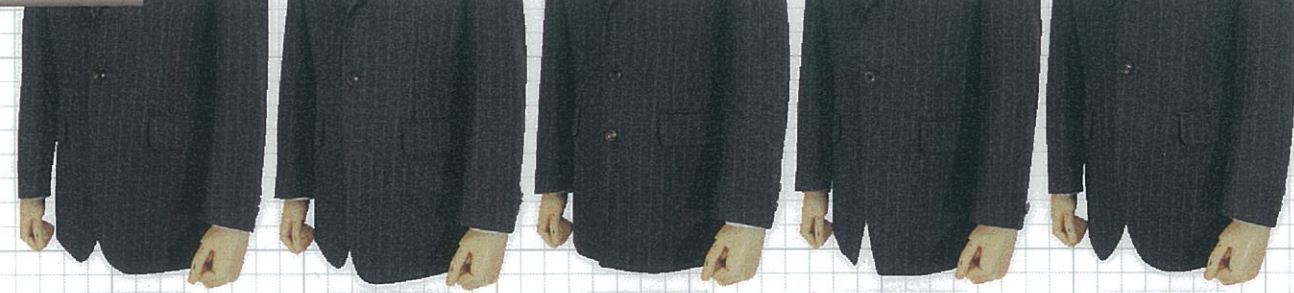
No01 レギュラー No02 小丸 No03 ダブル No04 スクエア No05 大丸