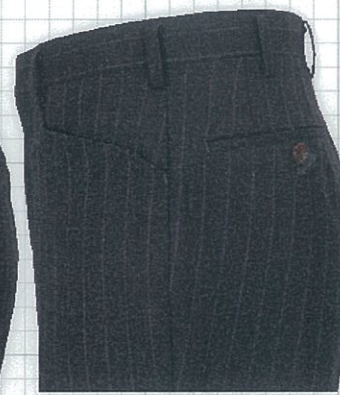
No.07 ヨコ ノータックのみ可能