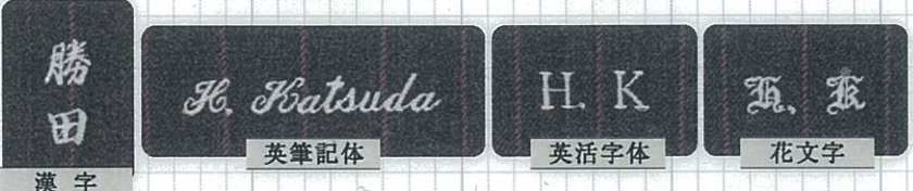
漢 字 英 筆 記 体 英 活 字 体 花 文 字