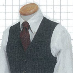
OP No.02 両玉