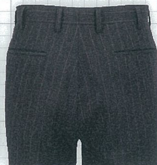
No.05 両ポケット釦なし