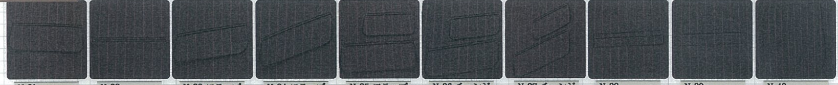
No31 フラップ No32 両玉 No33 フラップ スラント弱 No34 フラップ スラント強 No35 フラップ チェンジP No36 チェンジ スラント弱 No37 チェンジ スラント強 No38 両玉下広ブチ No39 ハコ No40 アウト