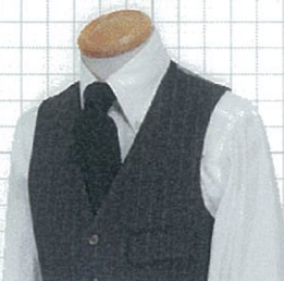
OP No.03 両玉フラップ