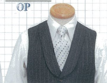
No.03 ショール OP