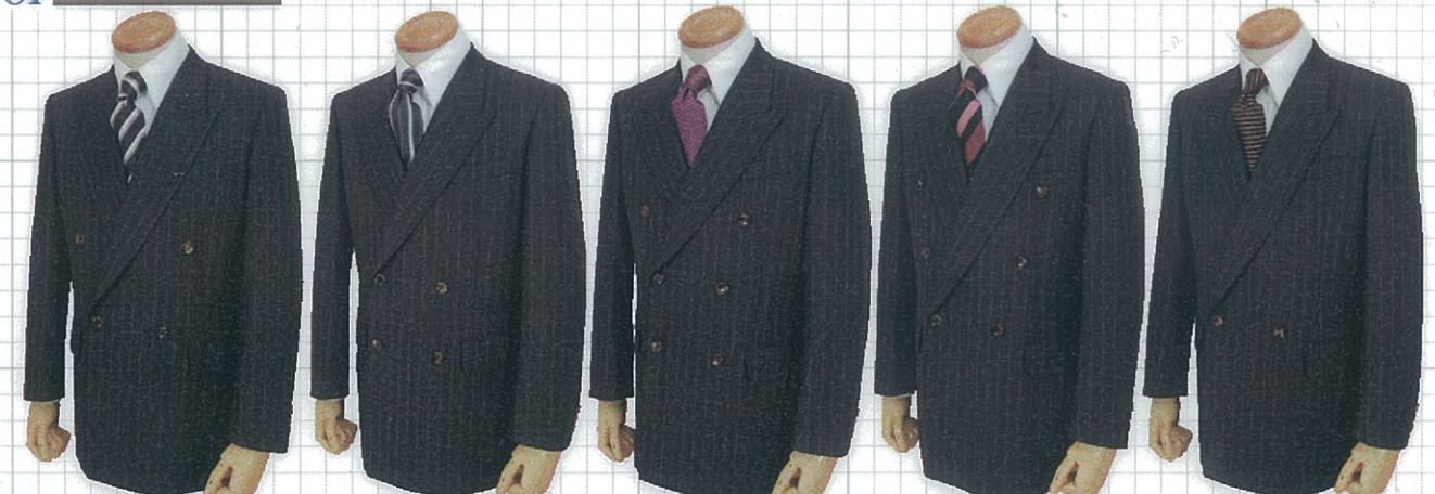
W4 釦 1 掛 け W4 釦 2 掛 け W6 釦 2 掛 け W6 釦 1 掛 け W2 釦 1 掛 け