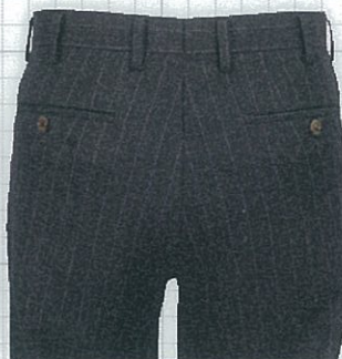
No.04 両ポケット釦止め