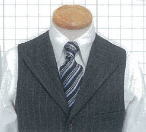
No.02 ピーク OP