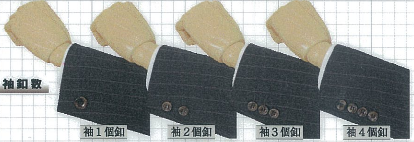
袖 1 個 釦 20mm 仕 様 袖 2 個 釦 J K 標 準 袖 3 個 釦 2 P 標 準 袖 4 個 釦