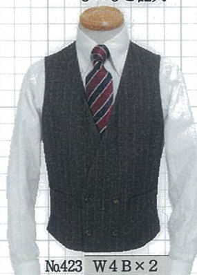
No.423 W4 B×2