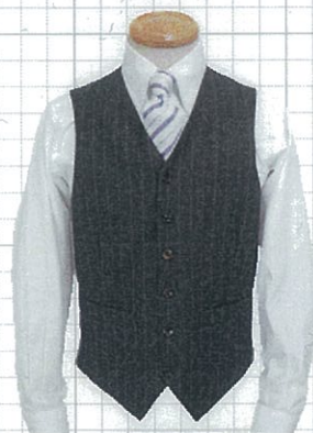
No.411 S 6釦6掛け