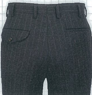
No.02 左ポケットのみ雨フタ