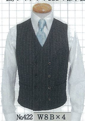
No.422 W8 B×4